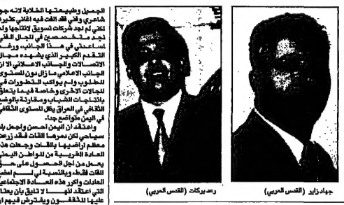
حاضر القاتح كيلوي